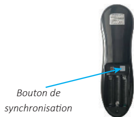
Bouton de synchronisation

Synchronisation de la télécommande Beaudoin